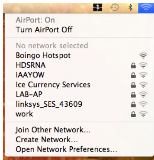
Liste des réseaux sans fil accessibles (Mac)